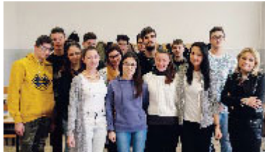
PORTO VIRO - I progetti dell'istituto

Giudicata positiva la possibilità di avvicinarsi a un impiego già dal terzo anno