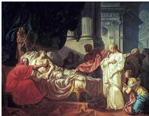
Jacques-Louis DAVID Antioch and Stratonice, 1774