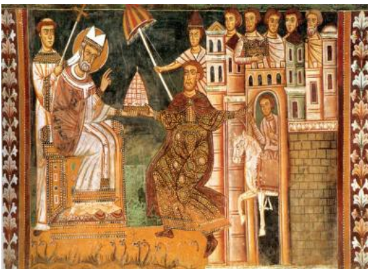
ORATORIO DI SAN SILVESTRO - Roma Donazione di Costantino, 1248